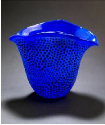
Blå Koral - vase