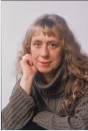
Karen Klím