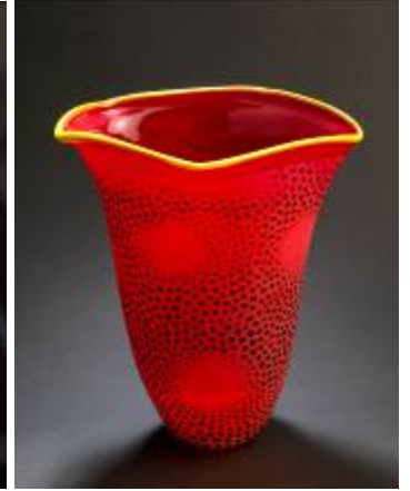
Caribisk minne - vase